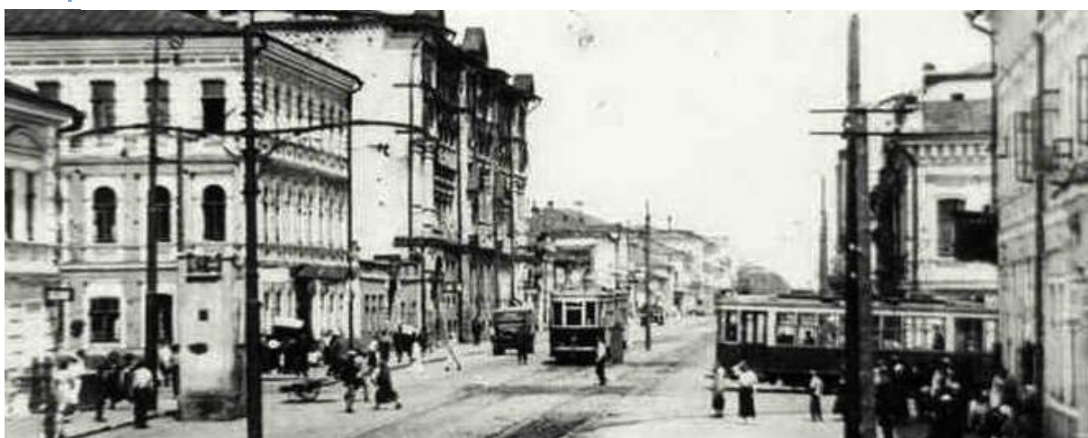
Семья Алешиных проживала по улице Венцека. На предвоенном фото пересечение улиц Фрунзе и Венцека